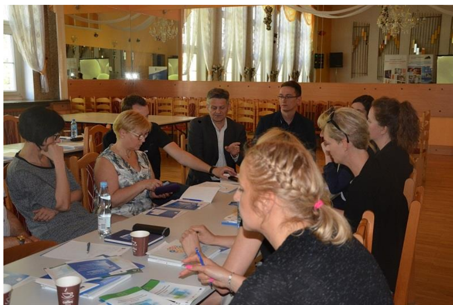
Warsztaty z przedstawicielami NGO