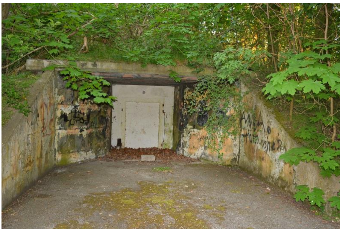
Opuszczony hangar poradziecki