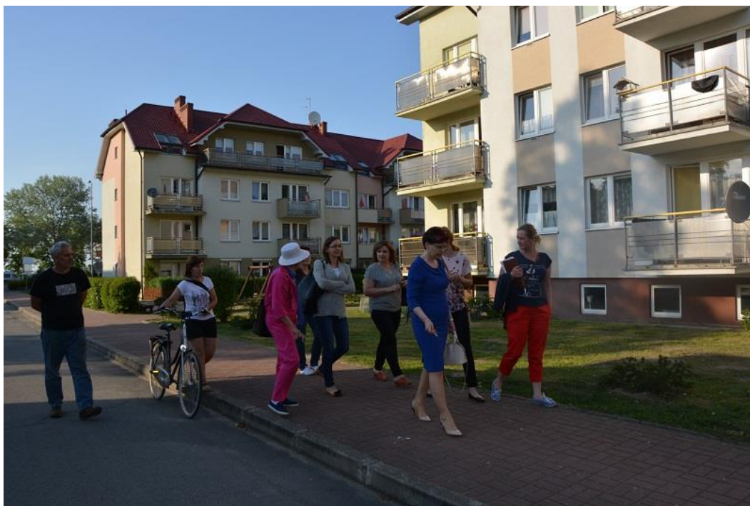
Uczestnicy spaceru studyjnego