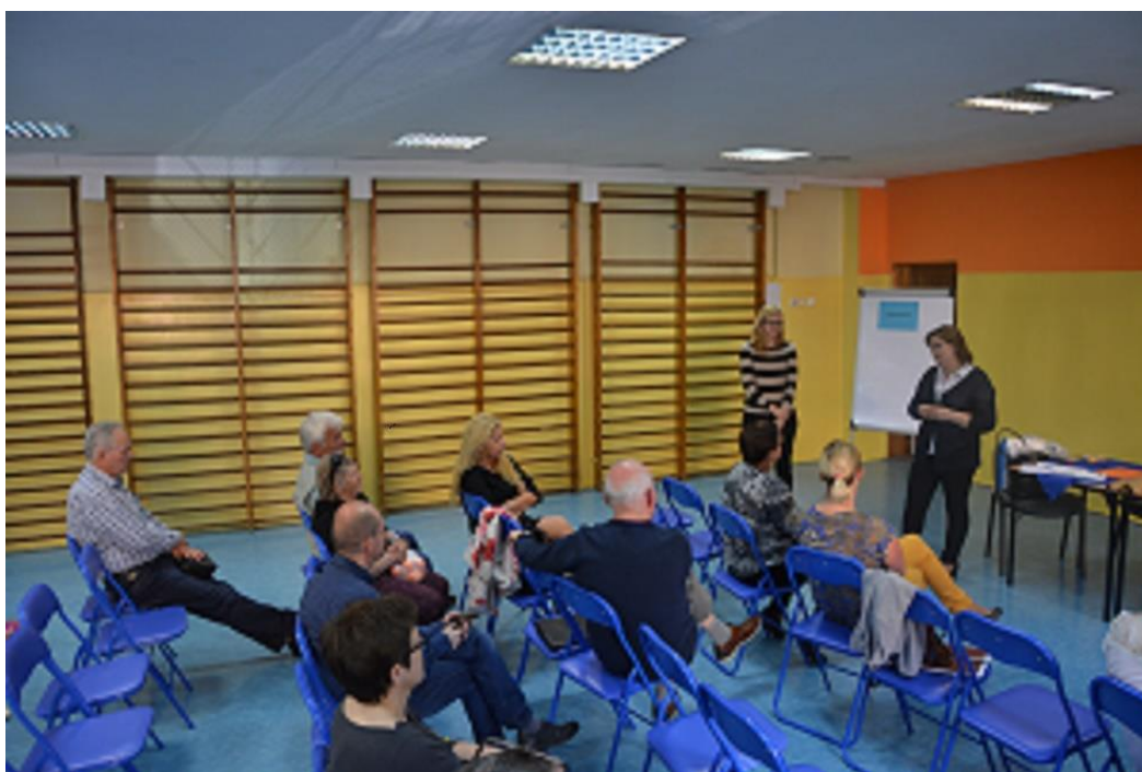
Mieszkańcy obszaru Śródmieście Starówka

Spotkanie odbyło się 5 maja 2016 roku o godz. 17.00 w Gimnazjum nr 2 przy ul. Bolesława Limanowskiego w Stargardzie. Prowadzone było przez przedstawicieli Urzędu Miejskiego w Stargardzie.