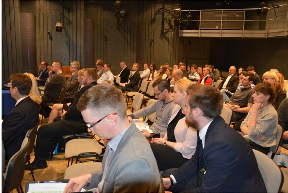
Uczestnicy konferencji dla przedsiębiorców