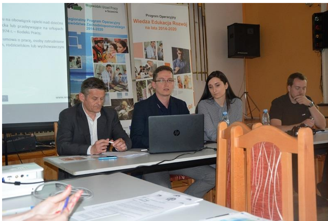
Przedstawiciele Wojewódzkiego Urzędu Pracy w Szczecinie oraz Urzędu Marszałkowskiego w Szczecinie