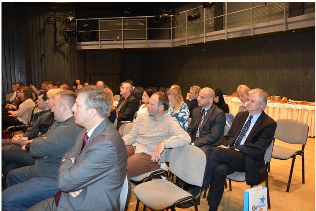
Uczestnicy konferencji dla przedsiębiorców