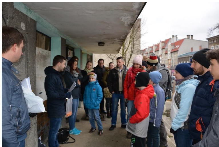
Uczestnicy Gry Miejskiej „W kamienicy dziurka – spójrz widać podwórka”