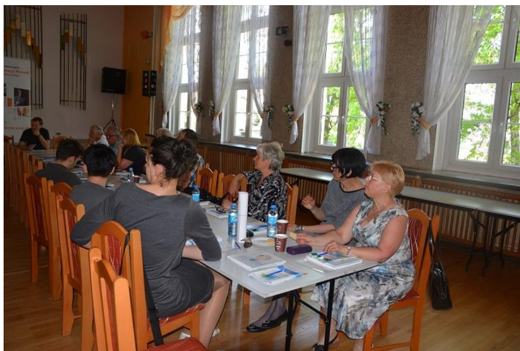
Uczestnicy spotkanie z organizacjami pozarządowymi