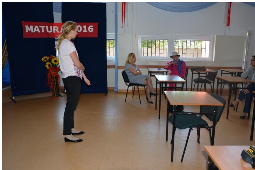
Spotkanie z mieszkańcami

SPACER STUDYJNY: Odbył się po spotkaniu, uczestnicy obejrzeli osiedle oraz mieszkania wspomagane. Obejrzeli zniszczone parki, w trakcie spaceru prowadzili rozmowy z mieszkańcami, którzy wskazywali na słabą komunikację oraz potwierdzili wskazane na spotkaniu problemy, jak również uczestnicy spaceru obejrzeli miejsca zniszczone, zaniedbane parki oraz miejsca zielone, gdzie konieczne jest ich zagospodarowanie.