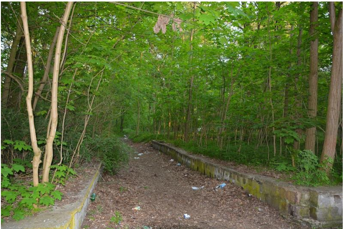
Park na Osiedlu Lotnisko