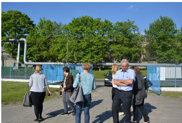
Spacer studyjny na obszarze Śródmieście-Zachód