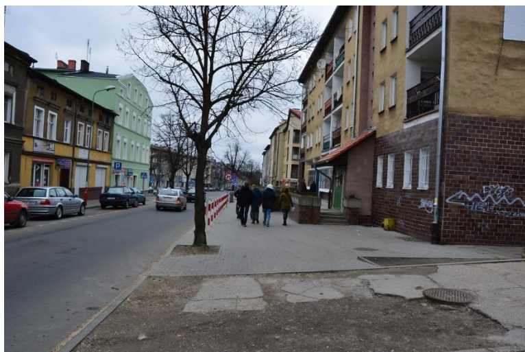
Uczestnicy Gry w terenie