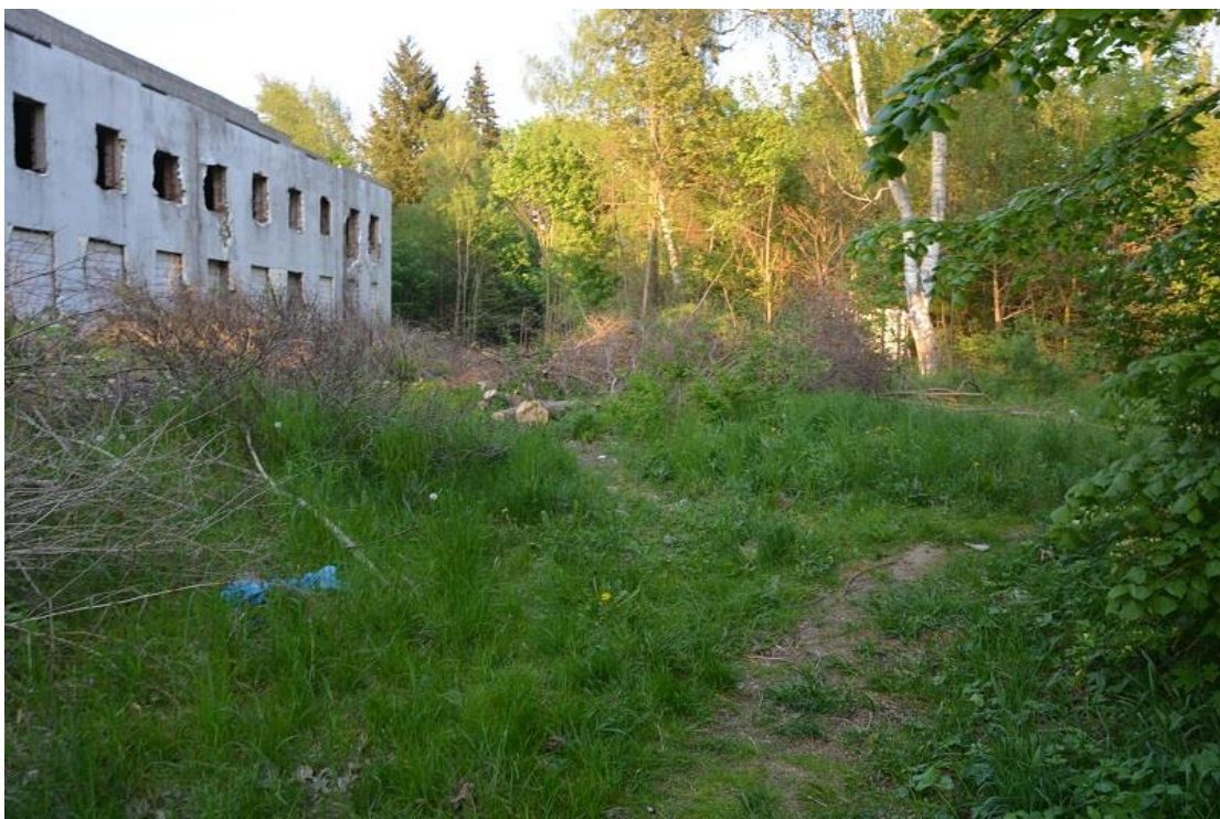
Zniszczona infrastruktura w parku na Osiedlu Lotnisko