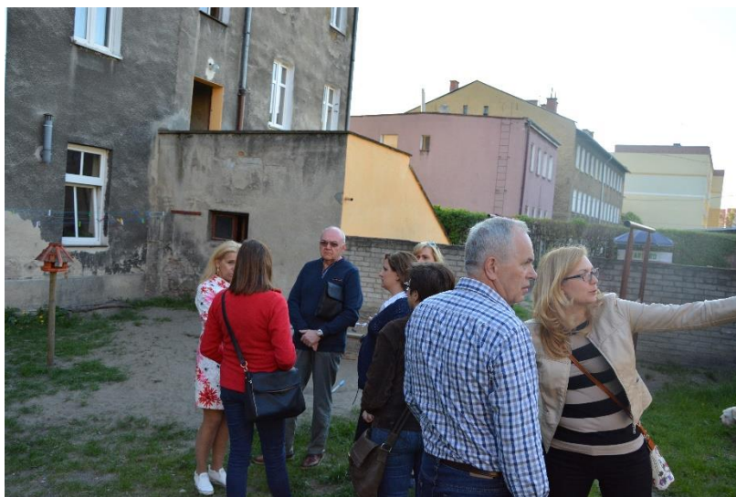
Spacer studyjny- ul. Wojska Polskiego