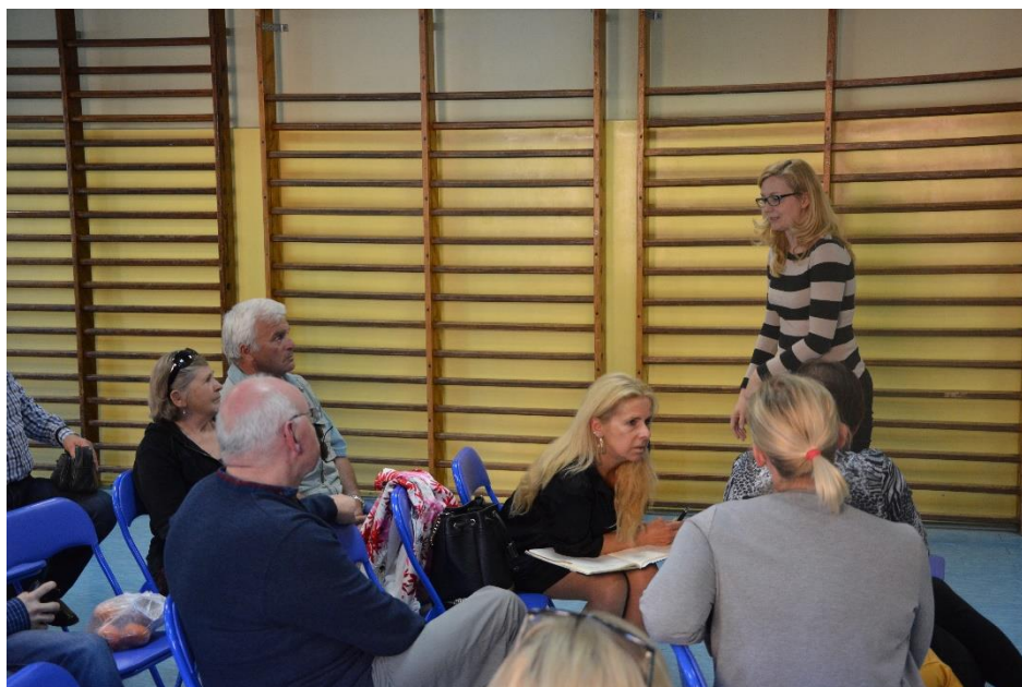
Mieszkańcy Obszaru Śródmieście - Starówka

W spotkaniu uczestniczyło 15 osób. Najpierw omówiono kwestie infrastruktury drogowej, stanu technicznego budynków, bezpieczeństwa, a następnie problemy społeczne, głównie zgłaszano uwagi dotyczące :