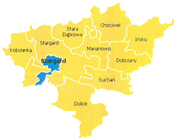
Rysunek 1. Gmina Miasto Stargard w powiecie stargardzkim

Gmina Miasto Stargard zajmuje obszar 48 km 2 . Według danych GUS z końca 2018 roku Gmina Miasto liczy 67.938 mieszkańców, a gęstość zaludnienia to w przybliżeniu 1.413 osób/km 2 . Gmina Miasto Stargard leży w południowo-zachodniej części powiatu stargardzkiego. W granicach jednostki znajduje się siedziba władz powiatu.