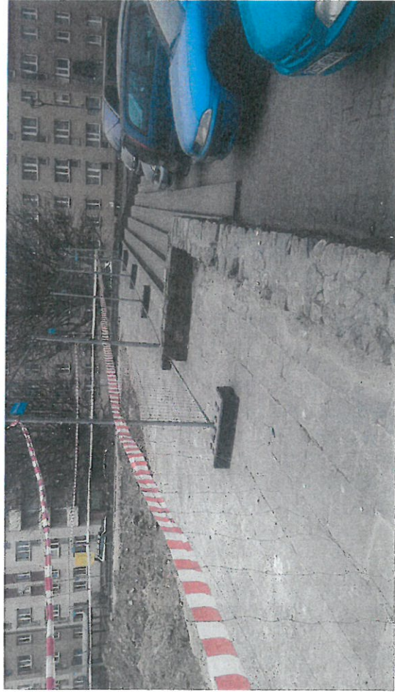
Proponowane miejsce na nowy stojak rowerowy