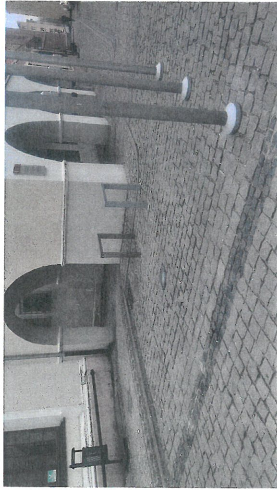
Stojaki rowerowe przy Ratuszu