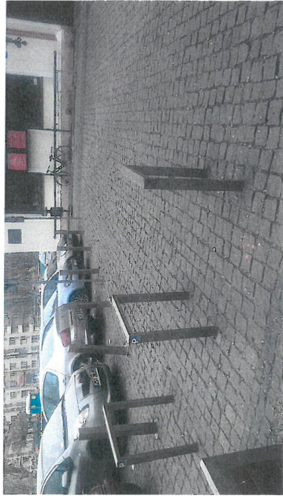
Stojaki rowerowe przy Ratuszu