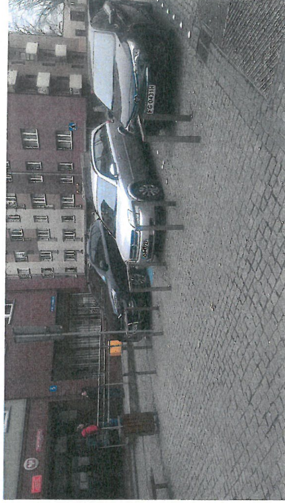
Stojaki rowerowe przy PODGIK