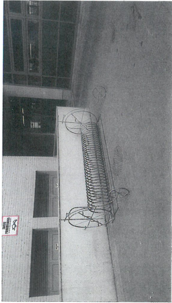
Stojaki rowerowe w Galerii Starówka