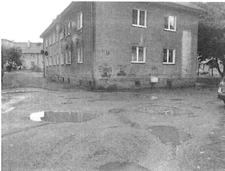
Fotografia 1. Wjazd na posesję

Poniżej pozwoliłem sobie przedstawić kilka fotografii, aby lepiej zilustrować najpilniejsze potrzeby, a fakt, że mieszkańcy sami pomalowali część klatki schodowej pokazuje ich determinację i chęć poprawy warunków.